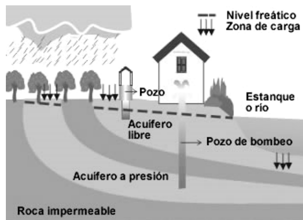
Esquema de un acuífero

Observe este dibujo/esquema y conteste a las siguientes cuestiones