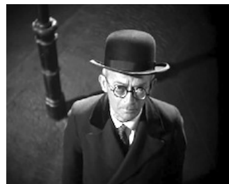
Fotograma de El vampiro de Dusseldorf (Fritz Lang, 1931)

4. Cuando la continuidad temporal de la narración cinematográfica se interrumpe para mostrar hechos del pasado se utiliza una técnica llamada: